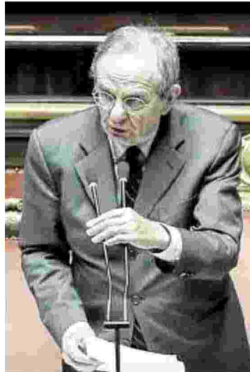
Il ministro Padoan al Senato

TRA LE RICHIESTE INSERITE NELLE RISOLUZIONI DELLA MAGGIORANZA ANCHE IL RAFFORZAMENTO DEGLI ASSEGNI PER I FIGLI